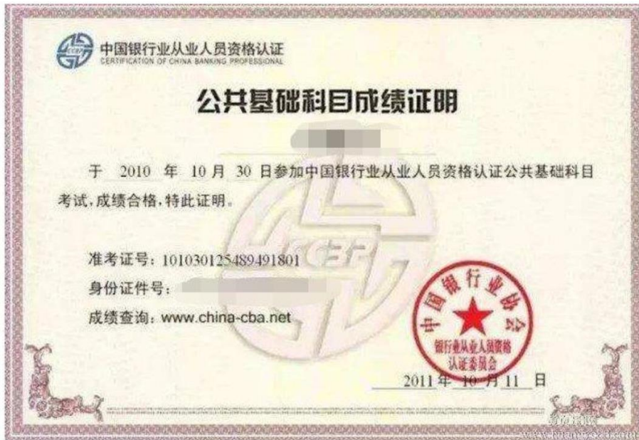
银行从业资格证书