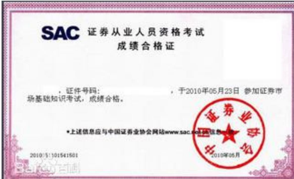
证券从业资格证书